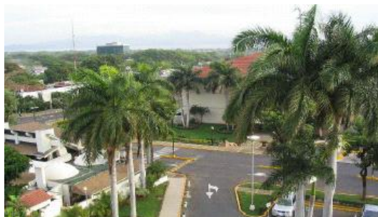
Vista de Managua desde mi hotel

Por el camino charlamos un poco, le transmito los abrazos de todos. Lo miro y no me creo que esté allí con él. No lo veo muy cambiado, poco pelo y todo cano ya, pero se le ve en buena forma, ágil.