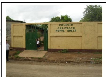
Entrada al Centro

Por último, como proyecto puntual, se pusieron Baldosas en el patio a un área de 112 m2 por un valor de 1.044,98 $.