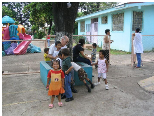
En el patio del Divino Niño

Pasamos un buen rato en el patio jugando con los niños. Hay un grupo variado de niños y niñas, entre los 3 y los 6 años sobre todo.