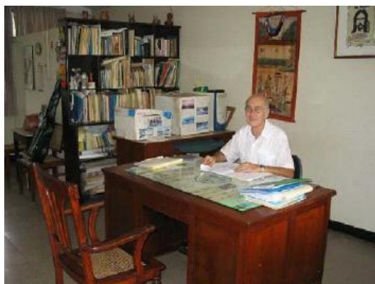
El despacho del tío en el Loyola