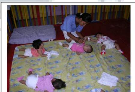
Atendiendo a los niños la cuidadora