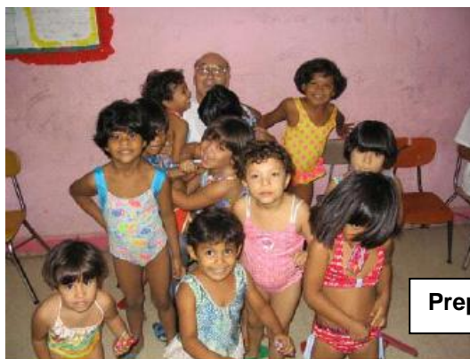
Preparándose para el baño en la piscinita

De camino a la sala de las niñas hay que pasar por el parque de recreo de donde salen tres niños corriendo “¡Padre, padre!” y se le abrazan a las piernas con tanto ímpetu que casi lo tiran.