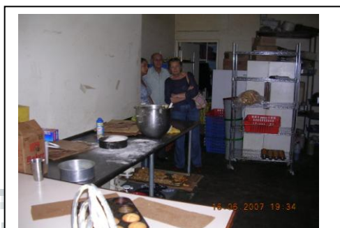
Visita a la cocina