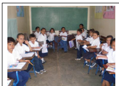
Los niños en clase