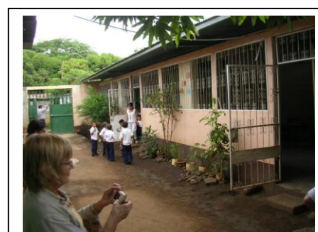
Aulas preparadas en el patio de casa