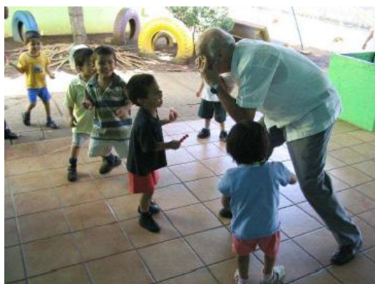
Los niños y el monstruo

A la entrada de la sala de las niñas hay una piscina de plástico al sol llenándose con la manguera dentro. Entramos y están todas en traje de baño sentaditas muy formales viendo la televisión. Entre las galletas, paletas (piruletas) de fresa y otras “chuches” del tío y las fotos de mi cámara digital, las revolucionamos a todas. En cuanto se toman un poco de confianza conmigo, me rodean y se me abrazan. Al tío le reclaman que las coja en brazos, “chíneme, padre, chíneme” (el término viene de que a las niñeras se las llama “chinas”).