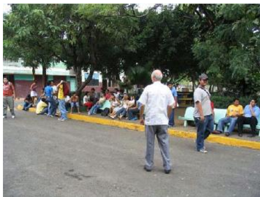
Los niños de Solidaridad que van a recibir clases de apoyo