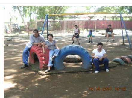
En los columpios