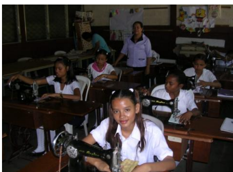
Taller de Costura