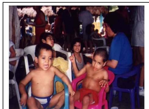
Jugando de paseo