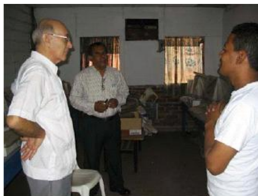
El aula de los ordenadores