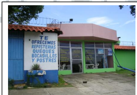
Pastelería del Hogar

Nuestro apoyo se centró en una cuota mensual de 273 $., para reforzar su alimentación con carne de pollo.