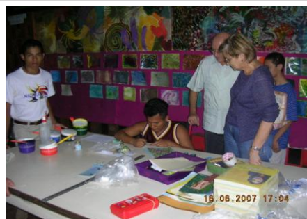
Taller de Serigrafía