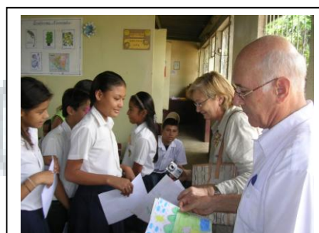
Visita al Centro en junio 2.006