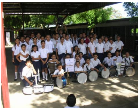
Banda de Música