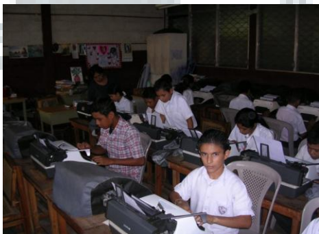
Taller de Mecanografía