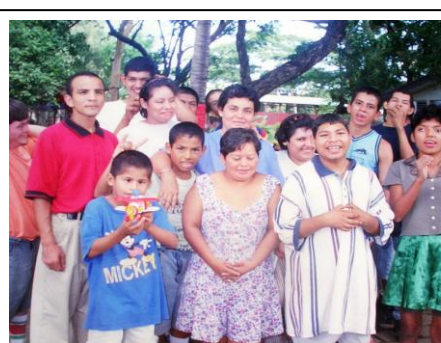
Sonriendo para la foto