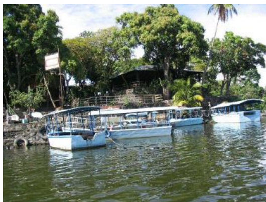
En el lago Nicaragua

Más descansados, salimos a hacer otra visita turística. Cogemos la misma carretera de ayer pero vamos un poco más lejos, hasta la ciudad de Granada, a la orilla del lago Nicaragua. La ciudad es muy bonita, tiene un inconfundible aire andaluz en su ambiente tropical. Llegamos hasta el lago y nos damos un paseo en barco. Me inclino para meter la mano en el agua, está caliente, nada que ver con las aguas canadienses.