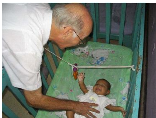
La enfermería del Divino Niño

La estructura del centro es parecida a la del Pajarito Azul, una serie de edificios individuales en un terreno cercado. También cuenta con una panadería para aumentar sus ingresos.